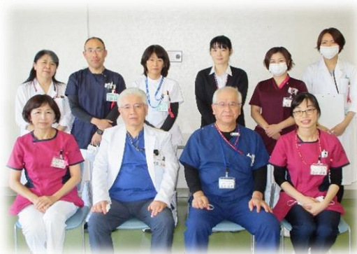
病棟スタッフ近影