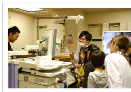
地域向け病院見学会（オープンハウス）