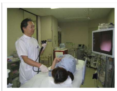
消化器病センター