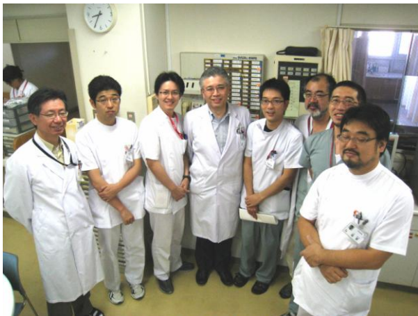
当院の8名のブラック・ジャックです

うち悪性腫瘍手術が417件と半数を占め、それに続く抗がん剤治療の病院全体での担当割合は7割になる。昨年12月に開棟した緩和ケア病棟利用患者の半数は外科の患者で、まさに集学的・包括的がん医療実践の日々である。呼吸器外科医の参入により、今期の外科診療実数の伸びも、(恐ろしいが)やりがいもある。